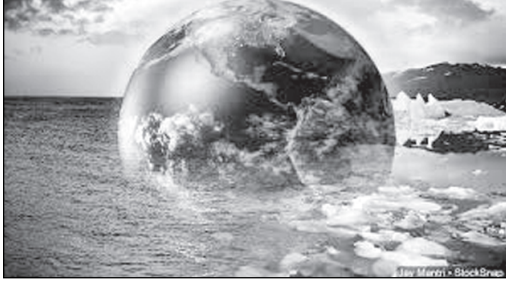
গোলকীয় উষ্ণতা বৃদ্ধি

ৰাষ্ট্ৰসংঘৰ দায়বদ্ধ আইপিছিছি বা 'আন্তঃৰাষ্ট্ৰীয় জলবায়ু পৰিৱৰ্তন মণ্ডলী'য়ে (Intergovernmental Panel on Climate Change; IPCC) গোলকীয় জলবায়ু পৰিৱৰ্তন সম্পৰ্কীয় ষষ্ঠ প্ৰতিবেদনৰ এটা খণ্ডৰ খচৰা প্ৰকাশ কৰিছে। বিশ্বৰ ২৩৪ গৰাকী নিবন্ধকে প্ৰথমবাৰৰ বাবে অনলাইন যোগে ১৮৬ ঘণ্টা মিলিত হৈ ৩০০০ পৃষ্ঠাৰো