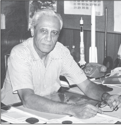
প্ৰফেছৰ সতীশ ধাৱান

১০ আগষ্ট ১৯৭৯ চন। সেইদিনা 'ভাৰতীয় মহাকাশ গৱেষণা সংস্থা'ই (ইছৰো) 'শ্ৰীহৰিকোটা মহাকাশ কেন্দ্ৰ'ৰপৰা প্ৰথমবাৰৰ বাবে 'এছএলভি-৩' (SLV-3) নামৰ এটা